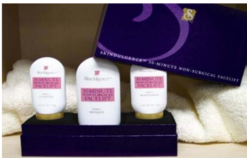
KIT FULL 120 EURO